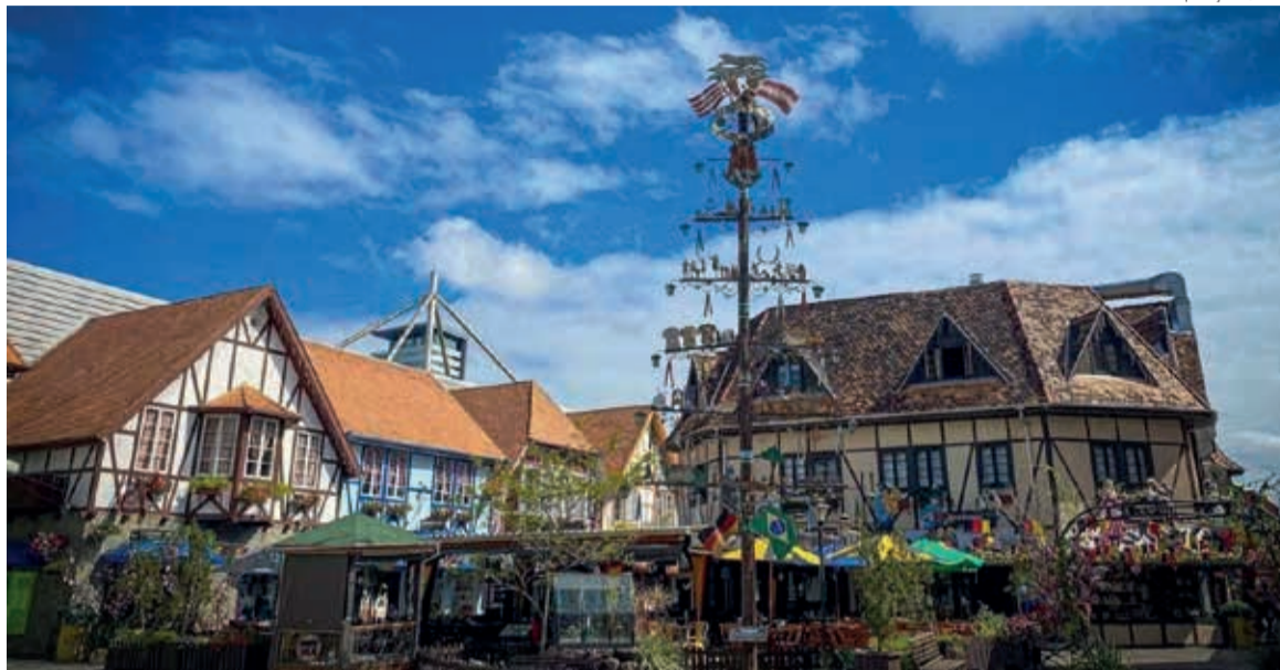
As festas de outubro na região transmitem a impressão de que todos os imigrantes são germânicos

A variada e complexa composição étnica também gera um terreno de disputas, onde grupos tendem a se impor. Disputas e rivalidades em maior ou menor grau, continuam. Chamo a atenção para uma certa “germanização” de imigrantes, os quais não sendo alemães, foram “alemanizados”