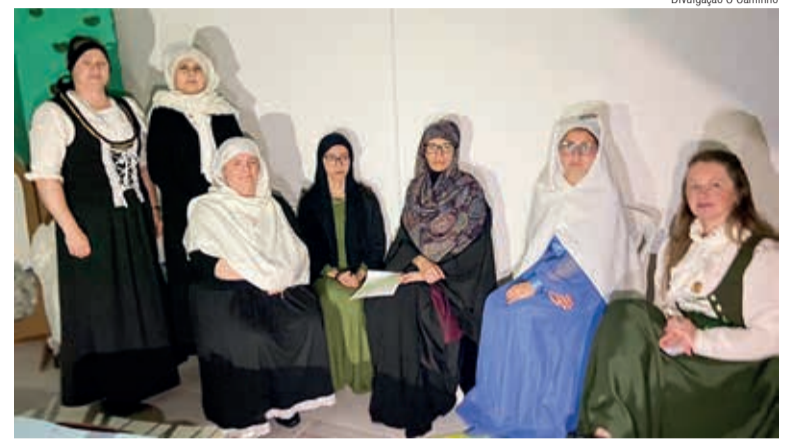
Mulheres que foram importantes na história da Reforma

Junto das histórias contadas, foi feita relação com a Rosa de Lutero. A noite foi um momento especial para resgatar nossa história confessional e de fortalecimento da caminhada de fé. Como igreja, conhecer histórias de determinação e perseverança nos anima a professar nossa fé em Jesus. E mesmo diante de situações difíceis da vida ter a certeza de que Deus, por misericórdia e graça continua conosco, nos cuidando. Ao fim da apresentação foi servido um delicioso café. Tudo só foi possível pela dedicação de muitas lideranças que não mediram esforços e contribuíram com seus dons.