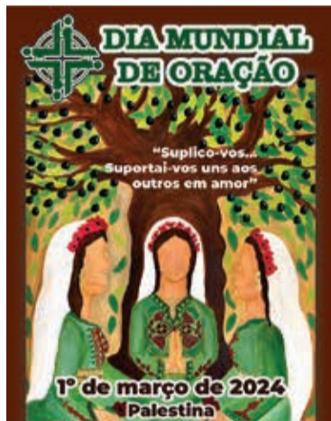
Cartaz do Dia Mundial de Oração, elaborado pela artista plástica palestina Halima Aziz

Após trinta anos, a Palestina foi novamente convidada a escrever os materiais para 2024. Este convite vem em um momento desafiador, quando a injustiça contínua não parou. É um momento de reflexão, de autoanálise e de viver aquilo em que acreditamos. O caminho é longo, mas as mulheres palestinas continuam servindo