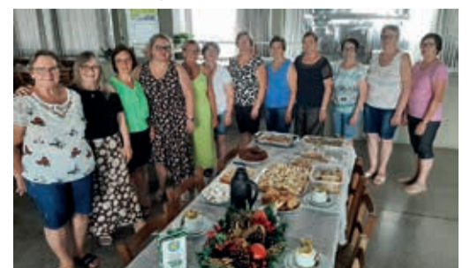
Reunião da Diretoria da OASE - Encerramento