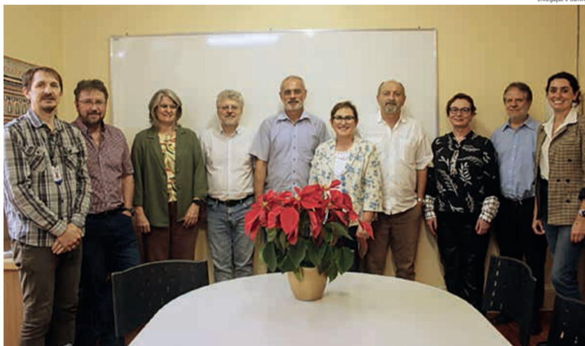
A reunião de oficialização do acordo entre a Faculdades EST e a Secretaria Geral da IECLB, dia 28/11

Informações sobre o processo seletivo ou outras formas de ingresso estão disponíveis no site da Faculdades EST. Para dúvidas ou mais informações, entre em contato pelo WhatsApp (51) 2111-1400 ou pelo e-mail comercial@est.edu.br . Aceite o convite para embarcar nessa jornada transformadora, onde a tradição e a inovação se encontram para a formação de lideranças do presente e do futuro.