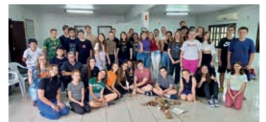
Encontro Paroquial de Confirmandos