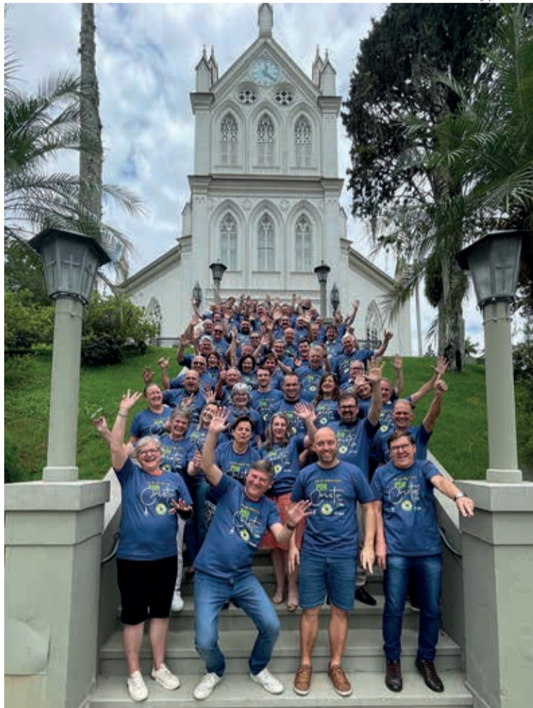
O Conselho Sinodal se reuniu na Paróquia Blumenau Centro

Na pauta da reunião ainda foi apresentado o desdobra-