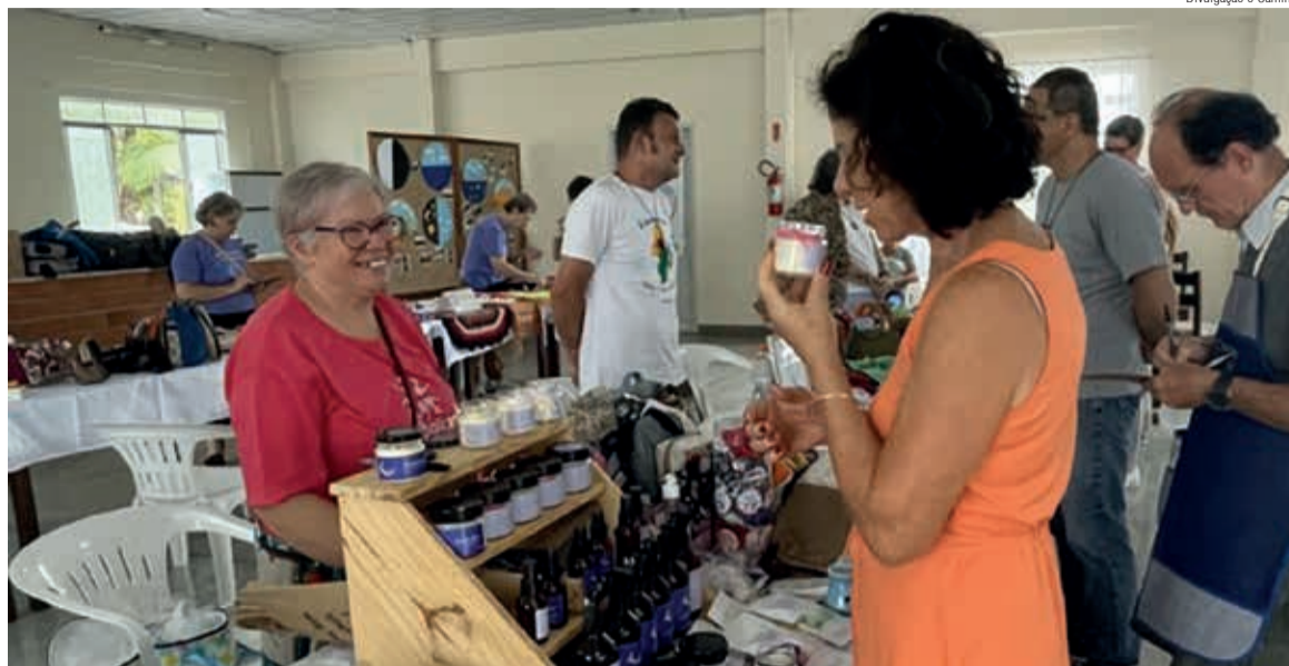
Durante o encontro aconteceu a Feira da Economia Solidária, com produtores catarinenses ligados à Rede

“A Rede de Comércio Justo e Solidário propõe outra forma de pensar o consumo, a partir de um compromisso social. A iniciativa também promove outra forma de consumo, mais consciente e responsável, aproximando consumidoras e consumi-