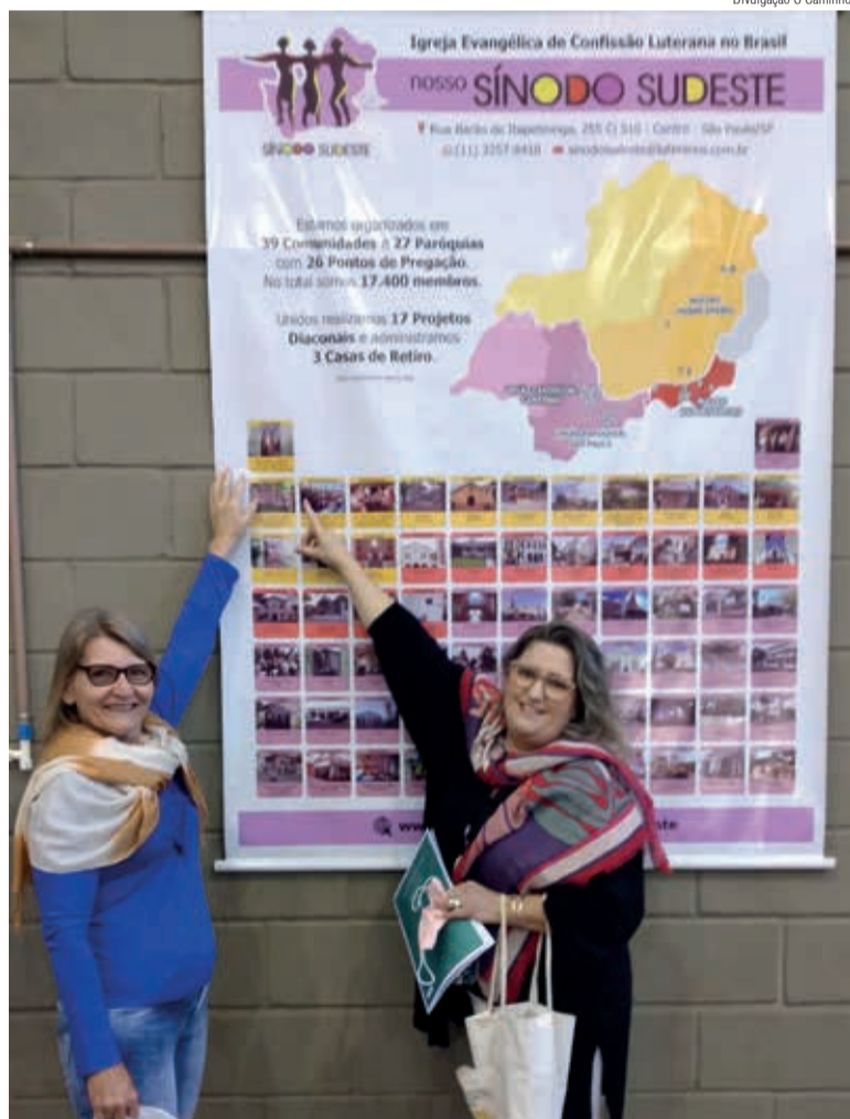
Divulgação O Caminho