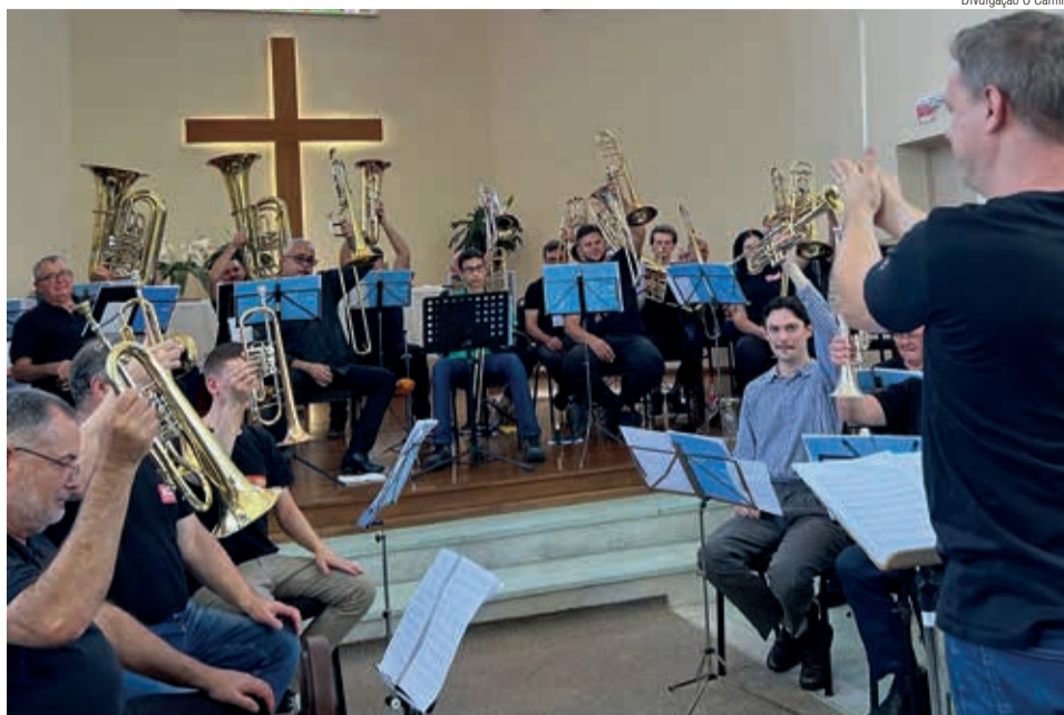
Alguns dos participantes do encontro de metais da Obra Missionária de Metais Acordai

“O que motivou a partir de 1984 abrir espaço para os metais no Conselho Nacional de Música da IECLB? Na época, tudo que era música foi reunido no Conselho, que coordenei. Foram dois motivos: