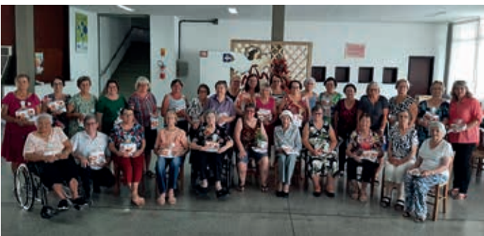
70 anos do Grupo de OASE GIRASSOL CCS