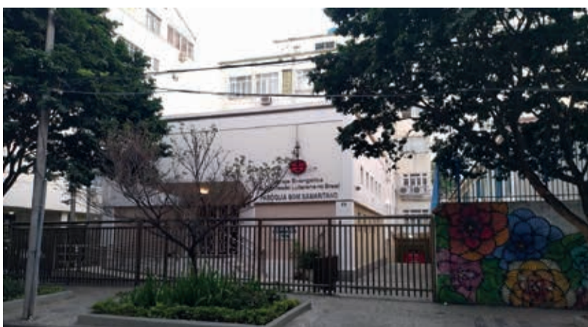
Paróquia Bom Samaritano, IECLB presente no Rio de Janeiro