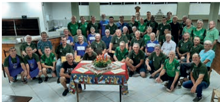
Encontro da LELUT