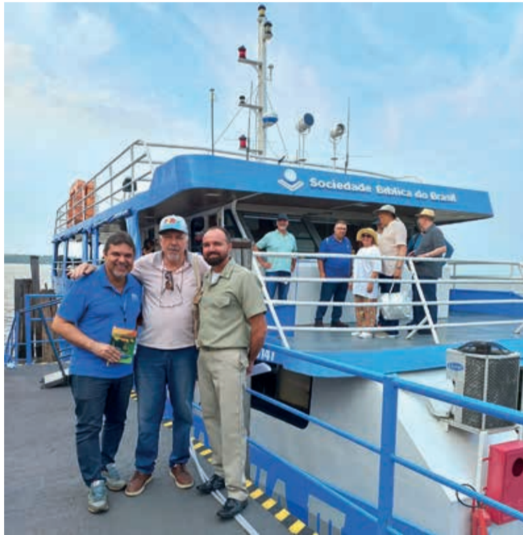
O autor, ao centro, a bordo do barco Luz da Amazônia, da SBB

A Regional da SBB em Belém abrange os estados do Pará, Acre, Rondônia, Maranhão, Piauí, Amapá, Roraima e Amazonas! Entre outros compromissos, constava do programa naqueles dias (24 a 27 de novembro) uma viagem com o barco Luz na Amazônia, que celebra 61 anos neste ano de atendimento social e espi-