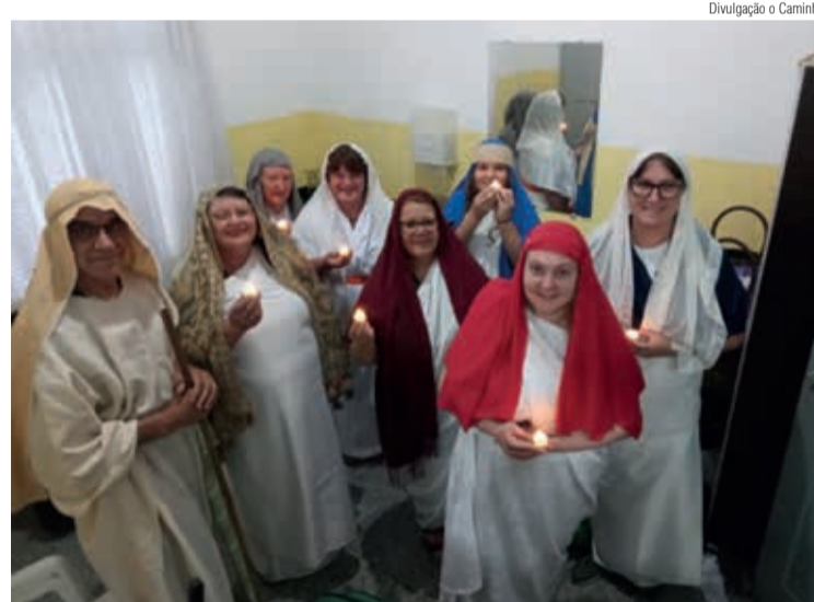
Encontro destacou que Jesus é a Luz do Mundo

Nos dias 8 e 9 de dezembro, a Comunidade de Três Rios do Norte, Paróquia Apóstolo Tiago, Jaraguá do Sul/SC, acolheu a 22ª edição do Projeto Cantando Hinos, com celebração de Advento sobre “Uma Promessa Antiga”.