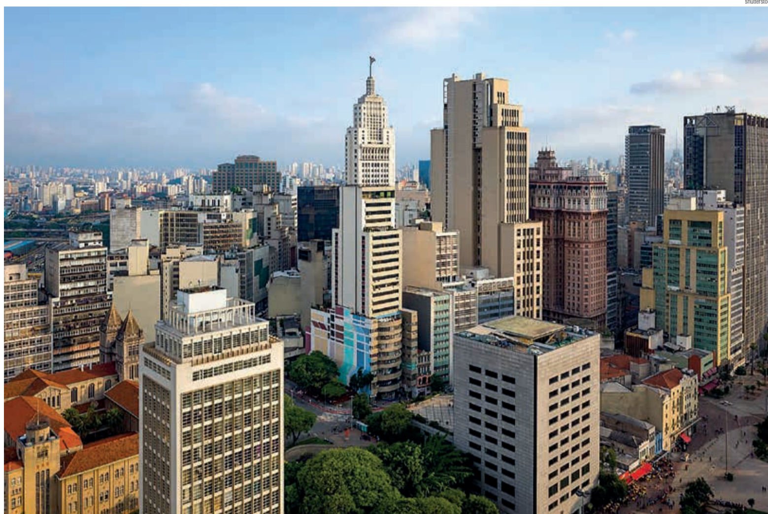
São Paulo, maior cidade do Hemisfério Sul, junta-se ao Rio e a Belo Horizonte, as três maiores metrópoles do Brasil, na área do Sínodo Sudeste

Há também o desafio da solidão. As ruas estão cheias de gente, mas não há interação. A multidão é solidão. Por um lado, isso é bom. Cada pessoa vive sua individualidade sem qualquer tipo de controle social. Por outro, a solidão adocece. Somos seres relacionais e interdependentes. Como garantir a individualidade e a comunitariedade?