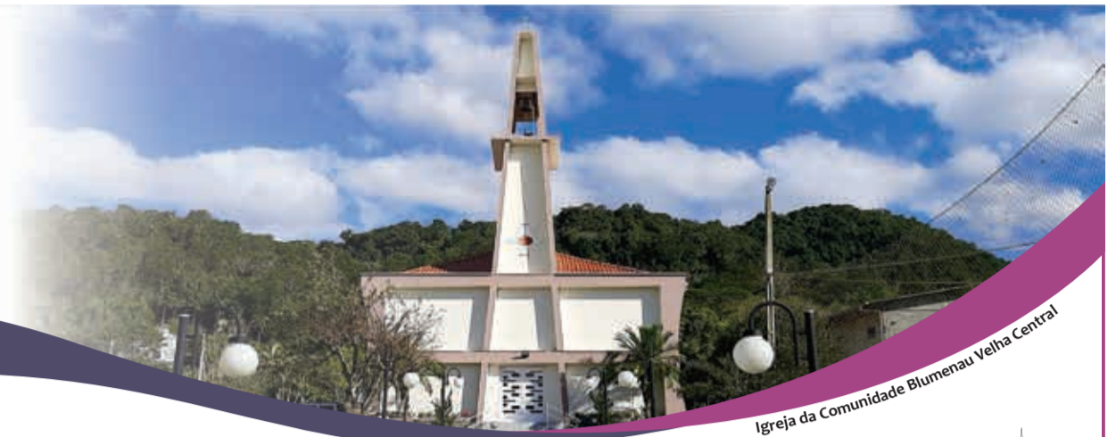
Igreja da Comunidade Blumenau Velha Central