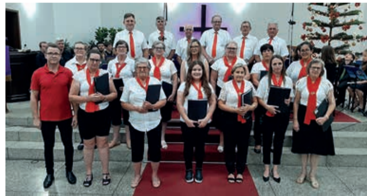
Encontro musical com os grupos de música e canto da Paróquia, instrumentistas da Paróquia mais orquestra jovem