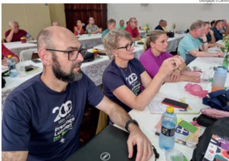
Integrantes do Conselho Sinodal reunidos em Rio Negro/PR

Ao total, em 2024, haverá um investimento missionário aproximado de 305 mil com recursos advindos de 0,5% da