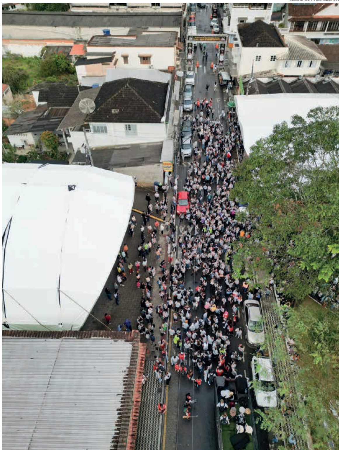
Jovens luteranos de toda a IECLB tomaram as ruas de Domingos Martins/ES durante o 25º CONGRENAGE

A juventude é sustentabilidade, justiça ambiental,