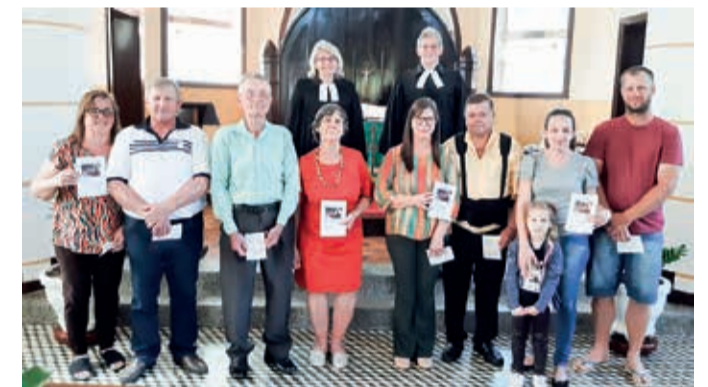
Bodas Casamento Paz