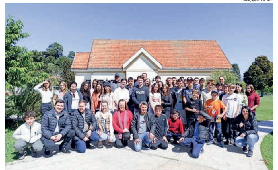
Os grupos de jovens de três paróquias meditaram sobre o tema Mãos à Obra

Momentos de louvor, esporte, gincana, e estudo da Palavra de Deus marcaram este tempo de comunhão. Na noite de sábado, os jovens literalmente colocaram a mão na massa e prepararam o jantar, com um delicioso Stockbrot (pão no espeto).