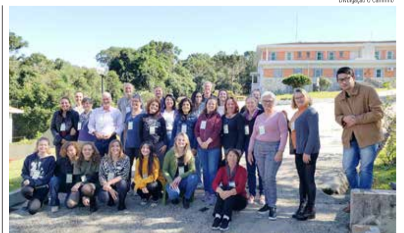
As pessoas participantes do encontro de planejamento da EEC