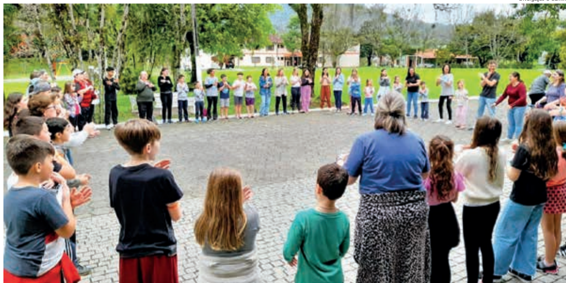
As crianças em um momento de canto com jestos realizado ao ar livre