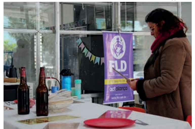
A violência doméstica tratada em encontros pelo Nem Tão Doce Lar