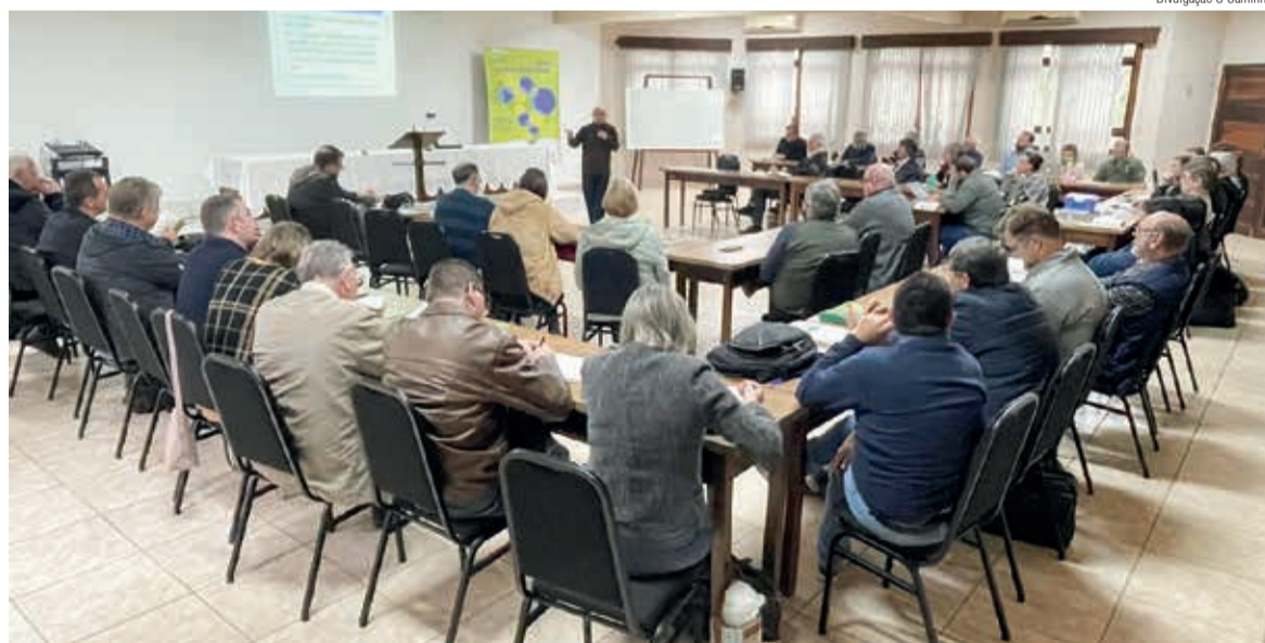
O grupo de ministros e ministras ouviu e interagiu com o palestrante sobre aconselhamento em Logoterapia

A Conferência Ministerial do Sínodo Vale do Itajaí abordou o tema “Aconselhamento Pastoral em Logoterapia - Aspectos