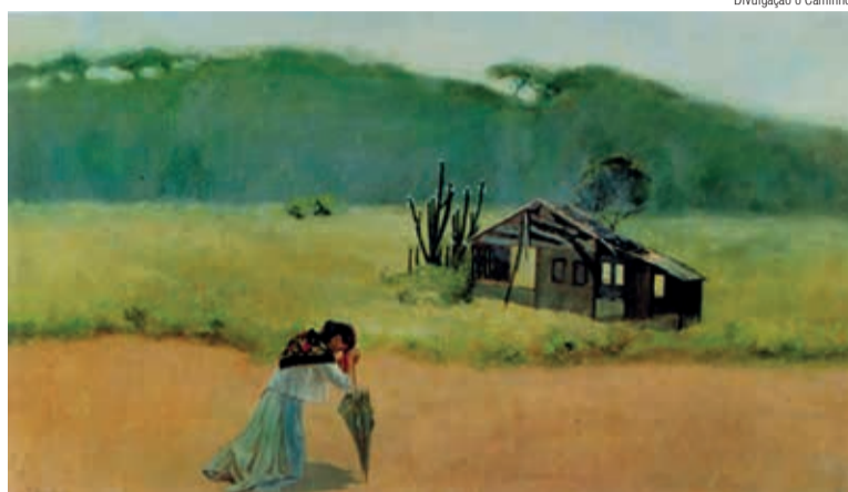
A pinura retrata uma imigrante desolada, o que despertava o desejo de repatriamento.

Muitos, mesmo desejando voltar, não podiam mais fazê-lo. Havia investido todos os