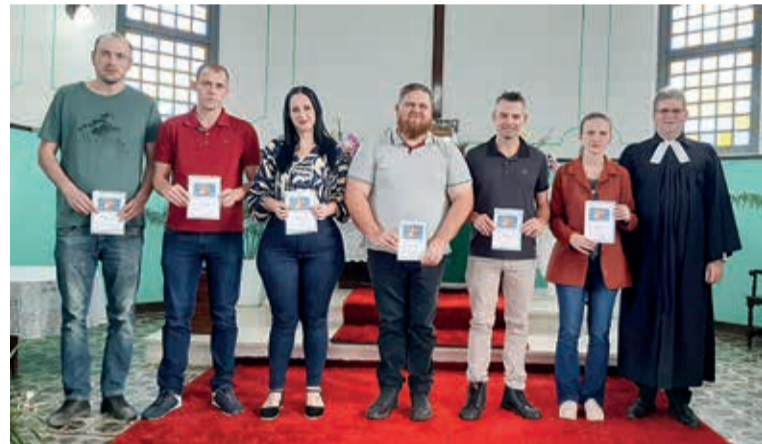
Jubileu 20, 25 e 30 anos de Confirmação Fé Comunidade Apóstolo Paulo