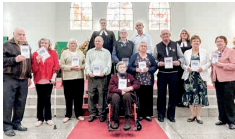
Jubileu 40,50,60 70 anos de confirmação de Fé Comunidade Cristo Salvador