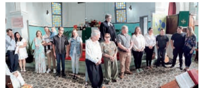
Bodas casamento Comunidade Apóstolo Paulo