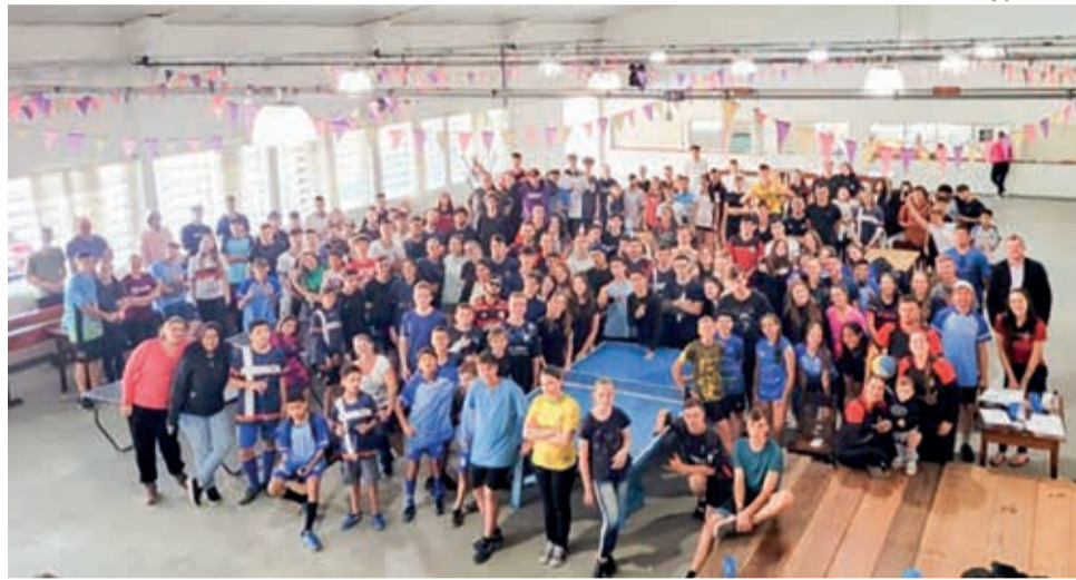
Os jovens atletas dos jogos paroquiais em Rio Bonito

A Paróquia de Rio Bonito-Joinville/SC realizou no fim de semana de 15 e 16 de julho a terceira edição dos jogos paroquiais. A Comunidade São Lucas de Rio Bonito acolheu os jogos. Um verdadeiro mutirão aconteceu na Comunidade para deixar tudo pronto após os fortes ventos que causaram estragos devido ao ciclone que passou pela região na quinta-feira anterior ao evento. Mas tudo deu certo e Deus concedeu dois dias