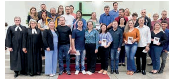
Bodas Casamento Paz