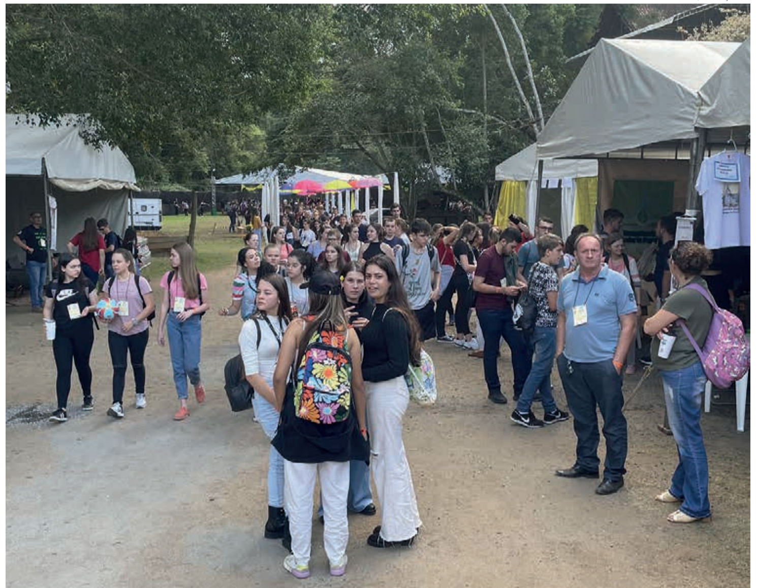
No 25º Congrenaje, em Domingos Martins/ES, as pessoas jovens planejam o futuro de sua caminhada dentro da IECLB

Na assembleia do 25º Congrenaje delegados e delegadas refletiram sobre a caminhada na igreja e destacaram que a juventude é cíclica. “Neste novo ciclo que se inicia, o desejo e convite é para construir, abraçar, ouvir, falar, amar e promover a paz, mantendo o testemunho da juventude vivo, ativo e protagonista em nossa igreja”. Além disso, é importante tornar a comunicação mais efetiva: divulgar e utilizar